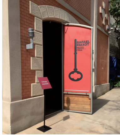
FOTOGRAFIA 18. Exposició de Rafael Patxot al Palau Robert.