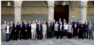
FOTOGRAFIA 11. Alguns dels seixanta-dos membres de l'IEC guardonats amb la Creu de Sant Jordi, al pati de l'IEC.