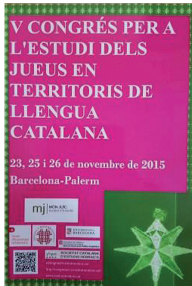
FOTOGRAFIA 6. Programa del V Congrés per a l'Estudi dels Jueus en Territoris de Llengua Catalana.