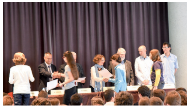
FOTOGRAFIA 13. Lliurament dels premis de la Prova Cangur de Matemàtiques 2016.