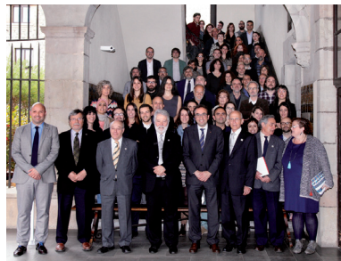
FOTOGRAFIA 10. Els premiats amb l'Equip de Govern de l'IEC, acompanyats de Josep Rull, conseller de Territori i Sostenibilitat de la Generalitat de Catalunya, i Ruth Mateu i Jaume Gomila, consellera i director general de Transparència, Cultura i Esports del Govern balear, a l'escala de la planta noble de la Casa de Convalescència.