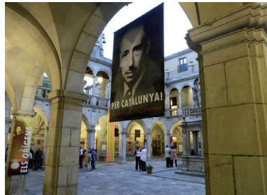
FOTOGRAFIA 19. Exposició «Per Catalunya! Vida i mort de Lluís Companys», al pati de l'IEC.