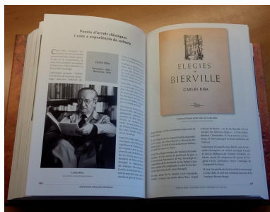
FOTOGRAFIA 7. Interior del llibre Aportacions catalanes universals .